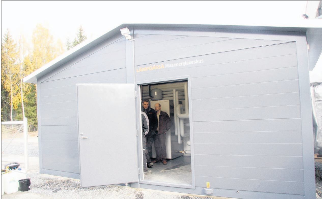
Pohjois-Savon ensimmäinen toteutunut maaenergiakeskus sijaitsee Lapinlahdella.